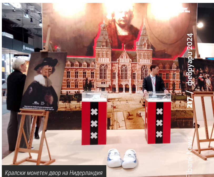
Кралски монетен двор на Нидерландия