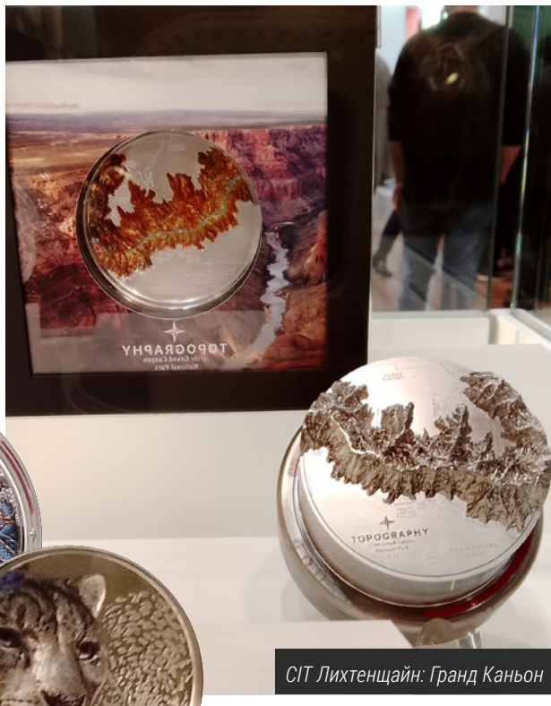
СІТ Лихтенщайн: Гранд Каньон