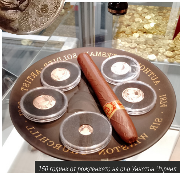
150 години от рождението на сър Уинстън Чърчил