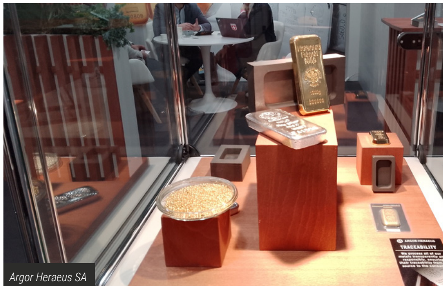
Argor Heraeus SA

Премиера на Световното монетно изложение беше присъствието на една от най-големите рафинерии за преработка на благородни метали, Аргор-Хереус (Argor Heraeus SA). Щандът представяше кюлчета и гранули от злато и сребро, произвеждани в Швейцария и Германия, сертифицирани и маркирани, съгласно изискванията и високите стандарти на Лондонската метална борса (LBMA). Интересът към тези продукти нарастна силно в периода по време на и след пандемията от Covid-19, което обяснява присъствието на гиганта в Берлин през тази година.