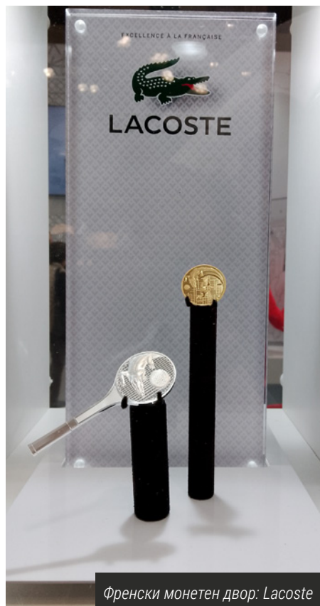
Френски монетен двор: Lacoste