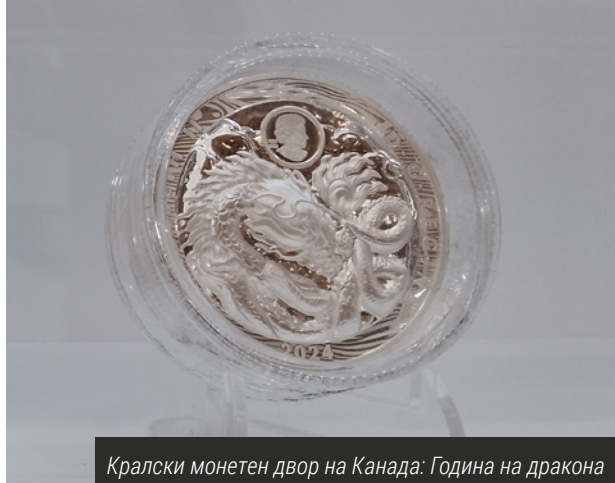
Кралски монетен двор на Канада: Година на дракона

На 150-ата годишнина от рождението на английския политик сър Уинстън Чърчил е посветена колекция от пет златни монети, придружени от любимата му пура.